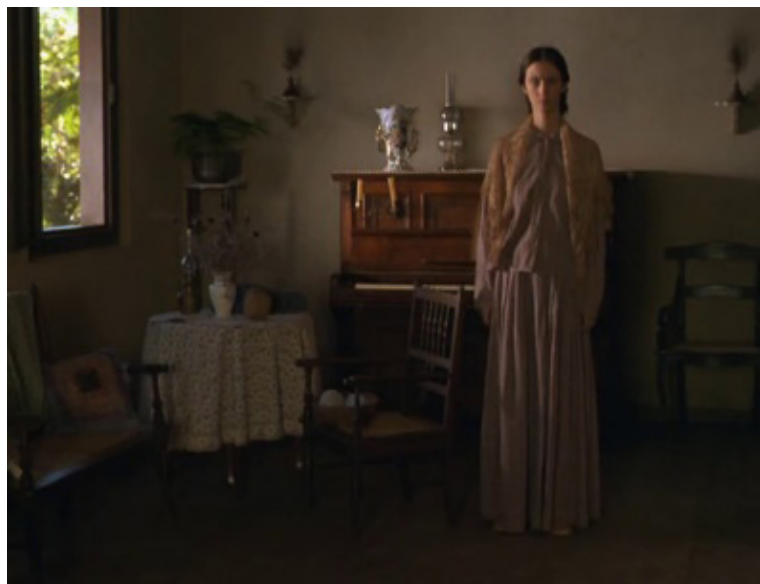
Imagem 6. Uma Vida em Segredo (Suzana Amaral, 2001)

Assim, quando Biela é “amansada” à moda burguesa e patriarcal, quando ela se torna “bonita” para o gosto masculino, a câmera e nossos olhares se aproximam dela, encontrando prazer visual em sua figura; mas quando ela volta à sua forma original, “selvagem”, a câmera se distancia. Suzana Amaral, então, através da linguagem cinematográfica, cria uma provocação que nos explicita a presença de julgamentos negativos em relação às origens rurais e modos rústicos da moça, bem como o desejo de que ela ceda ao modelo de feminilidade ideal, que se adequa às expectativas da família e, em certa medida, do público espectador.