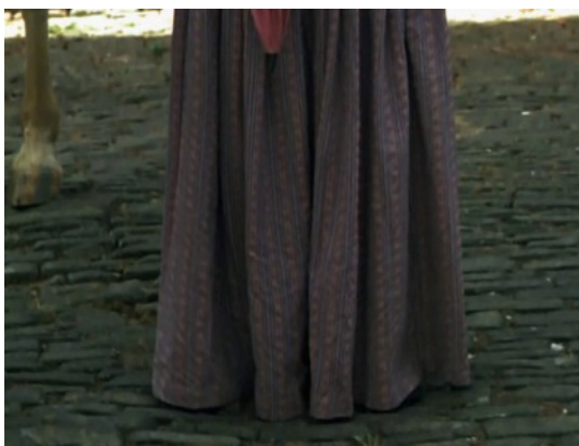
Imagens 2-4. Uma Vida em Segredo (Suzana Amaral, 2001) © Raiz Produções Cinematográficas