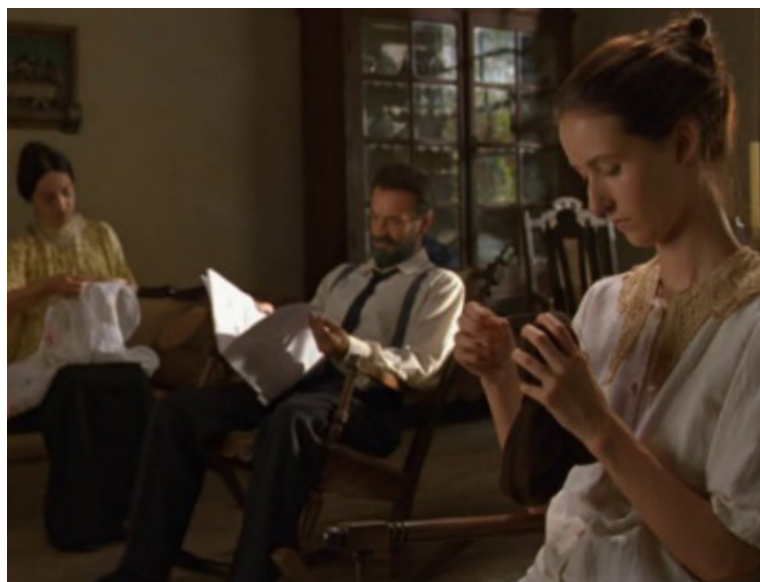
Imagem 1. Uma Vida em Segredo (Suzana Amaral, 2001)

Além da desigualdade entre mulheres e homens nos papéis familiares, a diferença entre mulheres é também revelada. Suzana Amaral nos permite entrever uma cumplicidade entre a perspectiva da câmera (assumida pelo público que consome a imagem) e a perspectiva das mulheres da cidade, que não se ampara no erotismo, mas ainda assim, relaciona-se à aparência e comportamentos da protagonista enquanto mulher. Em uma cena como o momento em que Biela chega da fazenda e é recebida por Constança, Mazília e Joviana à janela com comentários sobre sua aparência, a câmera mira o corpo de Biela, como se fosse uma figura animalizada, algo exótico, um “bicho do mato” olhado de cima a baixo, e realiza um movimento de tilt da cabeça aos pés de Biela, com um ângulo semelhante ao olhar das espectadoras curiosas à janela (imagens 2-4).