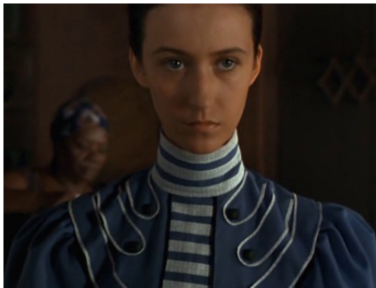
Imagem 5. Uma Vida em Segredo (Suzana Amaral, 2001)

Em contrapartida, após seu casamento ser arruinado pela fuga do noivo, quando Biela rasga seu vestido rejeitando todas as modificações impostas sobre ela, a câmera não mais elabora primeiros planos destacáveis, como se novamente criasse um afastamento, como se Biela voltasse a se tornar um “bicho do mato”, do qual é melhor não se aproximar (imagem 6). Quando ela se muda para o quarto dos fundos, não há mais espelhos que atraíam quaisquer olhares. Segue-se assim até o momento de sua morte, que é filmada de modo distanciado. Com isso, revela-se um possível olhar que tanto a família de Biela quanto o público podem assumir em relação à jovem: quando ela cede às regras da feminilidade urbana, criamos maior empatia por ela, mas no momento em que ela rejeita tais normas, provoca-se um afastamento, voltando-se novamente à rejeição da mulher caipira presente no início do filme.