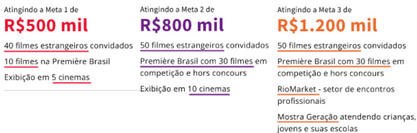
Figura 2 - Metas da campanha de crowdfunding do Festival do Rio na plataforma Benfeitoria.

No dia 12 de setembro, o Festival do Rio anunciou em suas redes sociais a possibilidade de cancelamento da edição de 2019 por falta de patrocínio. Uma semana depois, em 19 de setembro, foi anunciada e teve início a campanha de crowdfunding na plataforma Benfeitoria. A campanha aconteceu entre 19 de setembro e 28 de outubro de 2019, com contribuições com recompensas que iam de R$20 a R$50 mil [cerca de 3 a 7,5 mil Euros]. As recompensas incluíam o nome do apoiador no catálogo e website do festival, diversos artigos de merchandising com a marca do festival, como imã de geladeira, caneca, cartaz, camiseta, bolsa, convites para sessões e demais atividades da programação. A primeira meta, que precisava ser alcançada para o recebimento do montante, era de R$500 mil [cerca de 75 mil Euros]. Havia outras duas metas, nos valores de R$800 mil e R$1,2 milhão [cerca de 120 a 180 mil Euros]. A cada uma das metas estava atrelada uma versão diferente do festival, onde variavam o número de filmes e salas de cinema que fariam parte da edição (fig. 2).